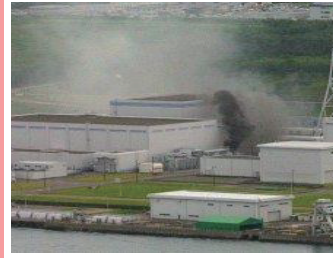
2007年 中越沖地震 変圧器火災