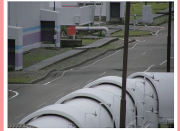
中越沖地震で波打つ 豆腐の上の原発