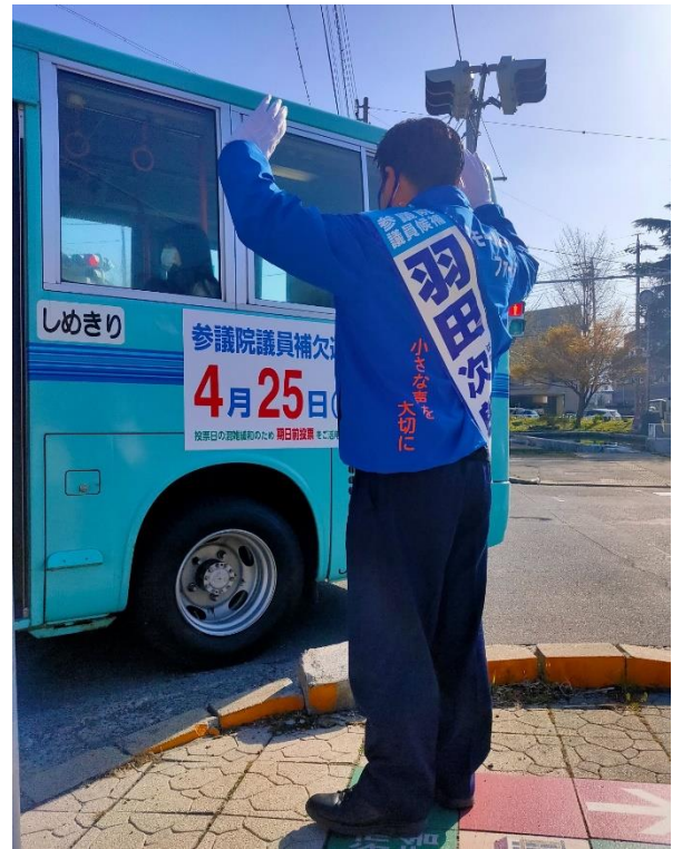
岡谷市役所前交差点で朝の手振り（20日）